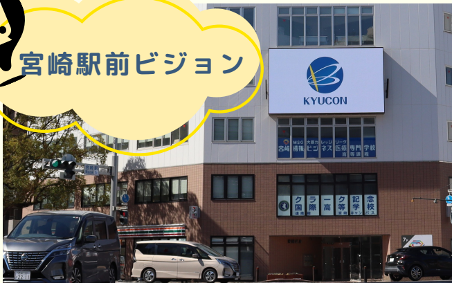
宮崎市高千穂通2丁目6-18 NMビル4階部分