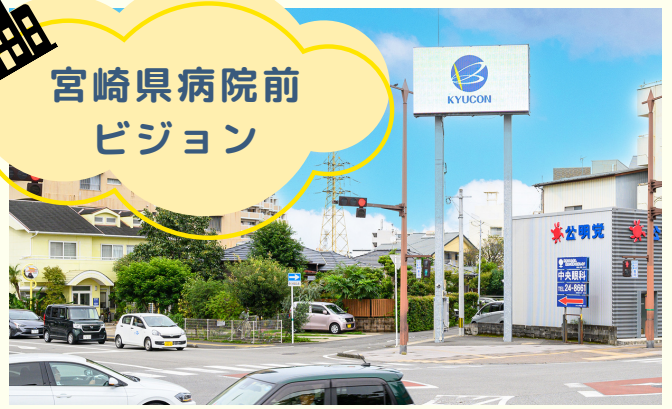
宮崎市清水3丁目1番1号 宮崎県病院前交差点